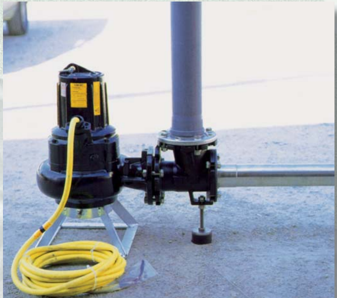
Made by Caprari - Modena Italia