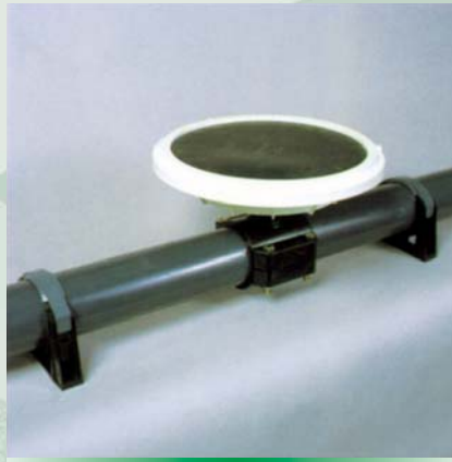
Made by Tierre - Milano Italia

Installations pour l'évacuation du chrome. La gamme des installations pour l'évacuation du chrome des bains de fin de tannage va des simples systèmes à précipitation/dissolution aux installations basées sur filtres-presses.