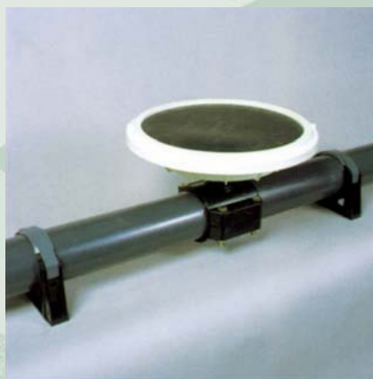
Made by Tierre - Milano Italia

For building its products on the market, such as dipping pumps and mixers, mono-screw pumps and distributors, electrical engines etc. produced by the main Italian and foreign factories.